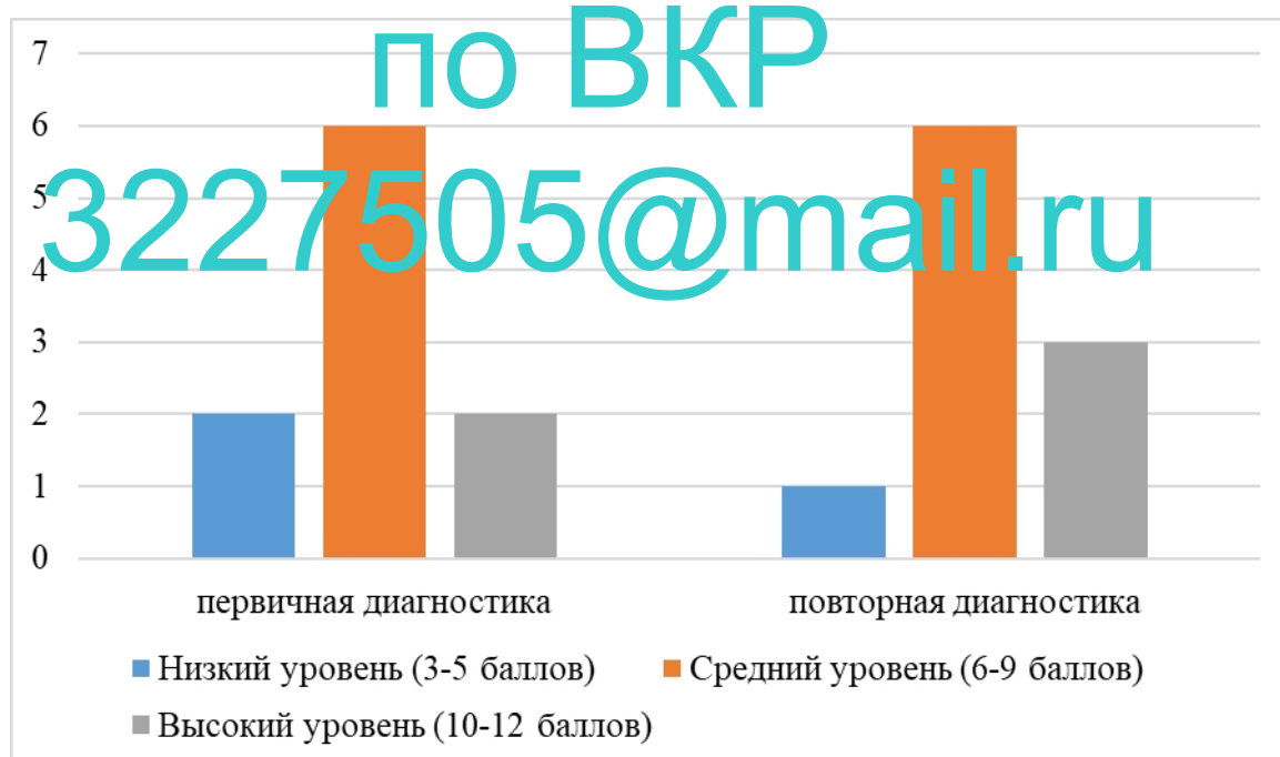
Рисунок 1 – Гистограммы частот уровня сформированности коммуникативных умений по методике «Рукавички»

Представим полученные результаты в виде гистограмм частот.